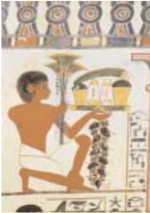
Diener mit Opfergaben: Früchte und Papyrusstrauch

die Papyrusbahnen nach Belieben kürzen oder durch Ankleben weiterer Blätter verlängern. Die längste aufgefundene Papyrusrolle misst über 40 Meter. Für die Breite der Rollen gab es in den verschiedenen Dynastien Standardmaße.