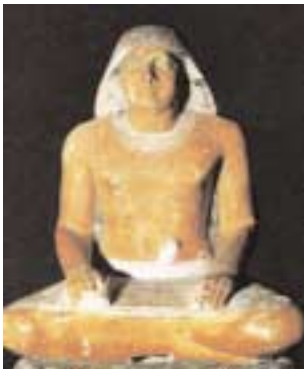
Schreiber 2400 v. Chr.