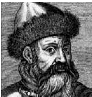
Johannes Gensfleisch (Gutenberg)

Paul Watzlawick: „Man kann in zwischenmenschlichen Situationen nicht nicht kommunizieren. Das heißt, dass alles Verhalten, das im Kontakt mit einem anderen gezeigt wird, Mitteilungscharakter hat.“