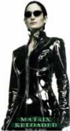
Filme als Trendsetter

Gute Gestaltung ist wie gutes Outfit – sie muss angemessen sein und zu uns / unserer Zielgruppe passen!