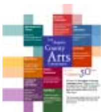
Visuelle Qualität durch Technik, Idee und Gestaltung

zur Gestaltung: „Vollkommenheit entsteht offensichtlich nicht dann, wenn man nichts mehr hinzuzufügen hat, sondern wenn man nichts mehr wegnehmen kann. “ (Antoine de Saint-Exupéry)