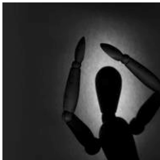
Bildmaterial: Vorsicht, Copyright!

Nur EINE wirklich wichtige Information hervorheben!